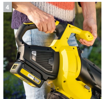
4 Вторая рукоятка