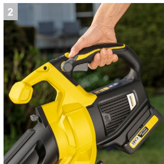
2 Регулировка частоты вращения